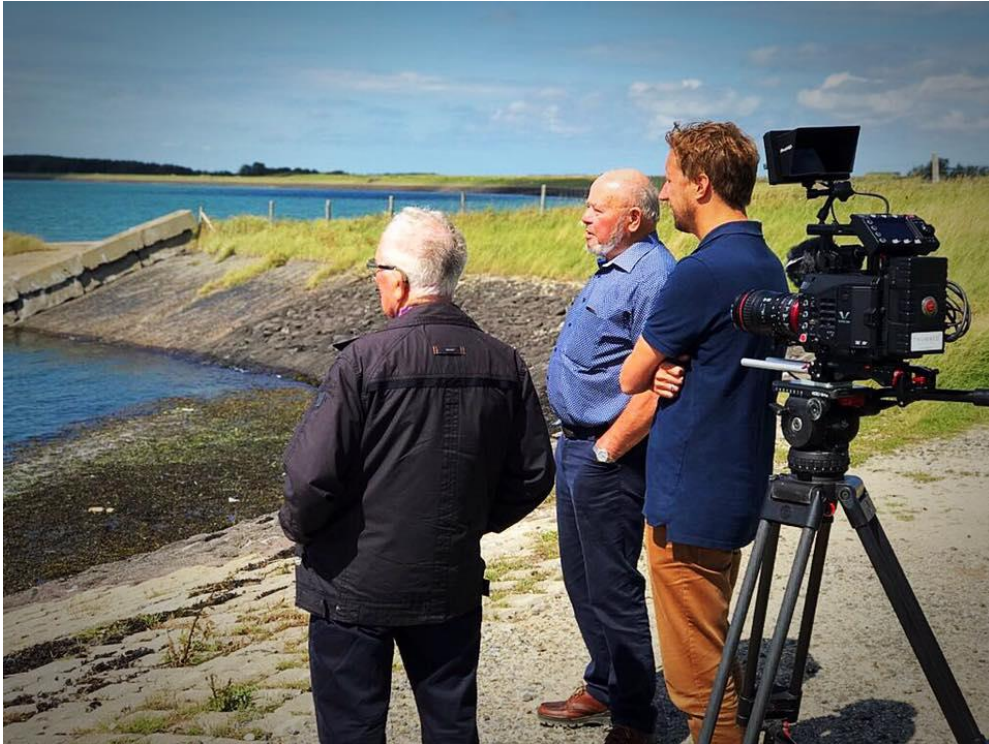
Beeld: tijdens opnames van Stormvloed in De Schelphoek (2018)