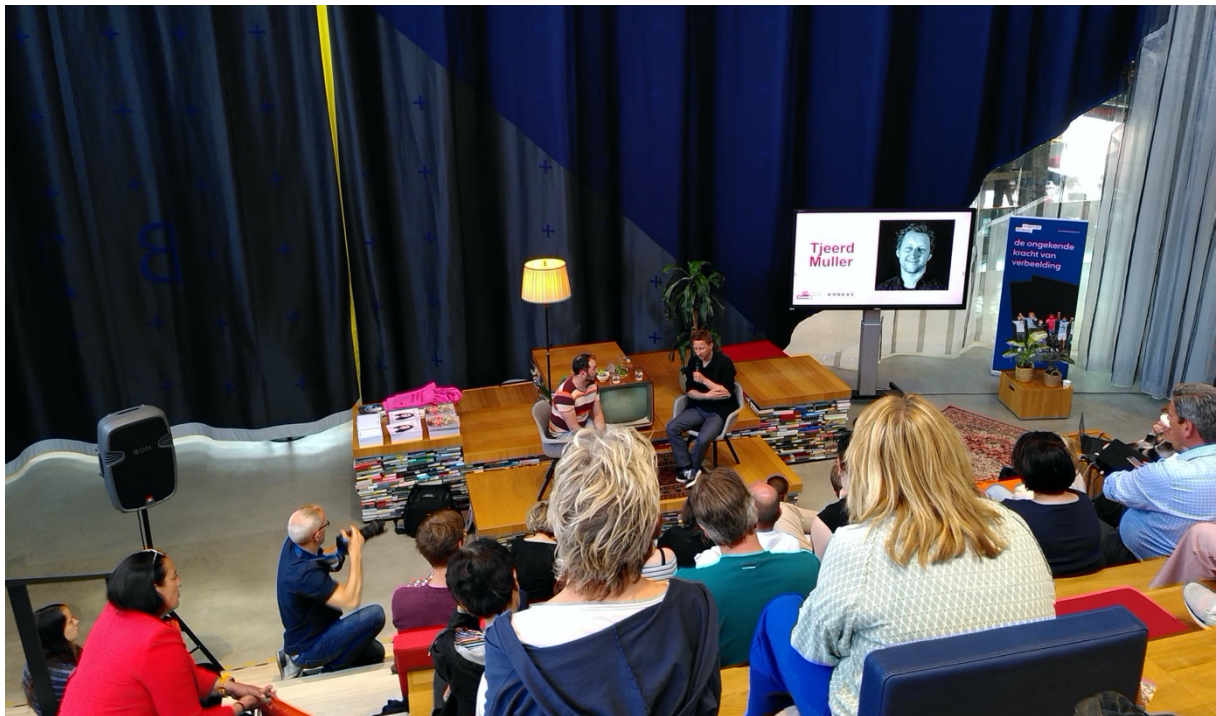
Vrijdag 13 mei 2022, LoCHal Tilburg